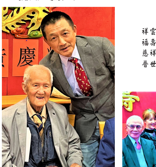
布文和黃老在賀壽晚宴上合照。