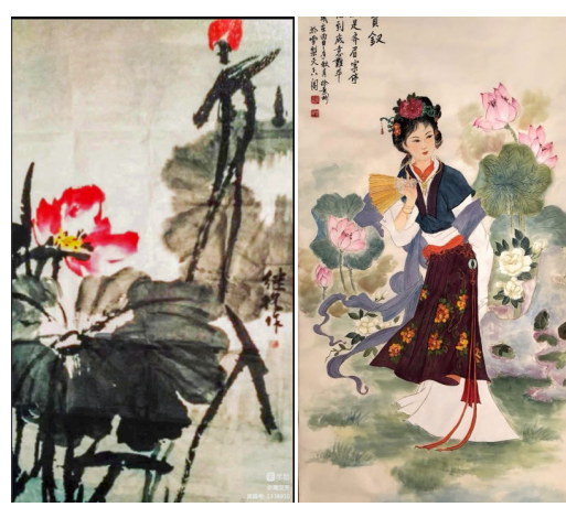
■譚文華國畫《清華小院沐春風》68X68Cm