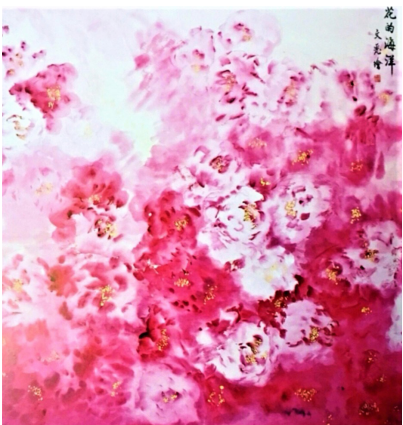
■黃文麗國畫《花的海洋》99x99cm