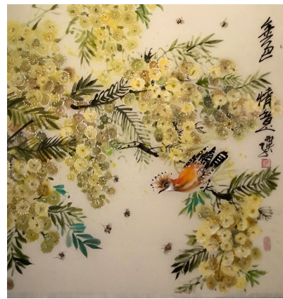
■陳秀英國畫《金色情意》65x65cm