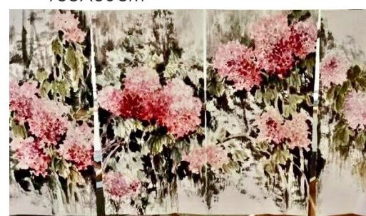
■徐希翹國畫《花團錦簇》66CmX33Cm