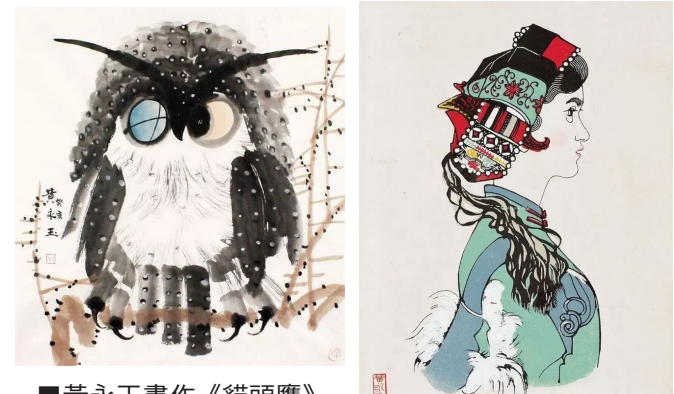
黃永玉畫作《貓頭鷹》