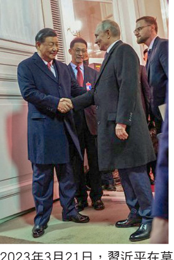
2023年3月21日，習近平在莫斯科與普京會談結束後在大門外握手告別。

在習近平“雄才大略”中，實現他的專制國家統一的“中國夢”是他構建“人類命運共同體”的核心，而需的出現是其應有之義。他這個“百年變局”，就是改變現行國際政治秩序，改變民主自由的世界，讓全球納入他的專制制度的治理範圍。這即是要完成毛澤東所謂“解放全人類”的使命，實現中共百年來沒有做到的事情。然而，習近平能做到的嗎？看來這只不過是鬼鬼的痴人說夢，一廂情願罷了，儘管他的黨徒他的小大幹將吹捧習主席高瞻遠矚，洞察秋毫，聖明神武；聖明神武說“如果決定打台灣，基本上說上午從福建出發，晚上就在台灣偽總統府開慶功會”；儘管他們深信在百年變局中失去的只是一百多年來的沉重恥辱，而得到的將是整個世界；儘管他們叫囂“中華民族必將在核大戰中得到真正的復興”。除了這是極其恐怖極其罪惡的設想，等待他們的將是歷史的嚴正審判。歷史正義絕對不會在習近平及其集團一邊。