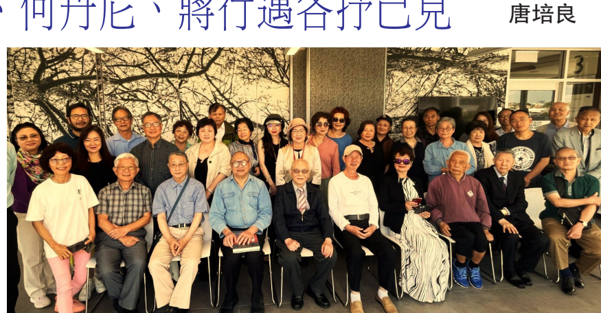
■2023年11月11日“澳華文學三十年”研討會部分與會者合照。

年輕的小蘇律師和年長的畫家徐希翹也在研討會上發了言。此次研討會非常成功，大家暢所欲言，坦誠交流內心的真實想法，也是一次“普世價值”的真實體驗。