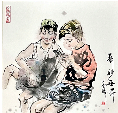
《奇妙世界》國畫40x40cm 黃瑜