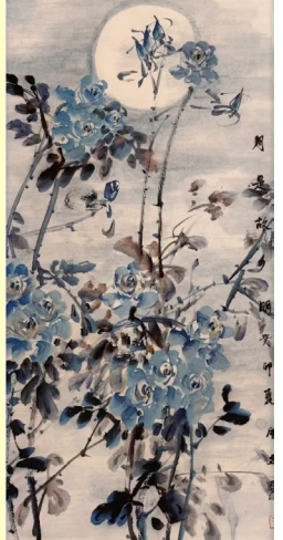
《月是故鄉明》國畫70x138cm 黃文麗