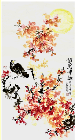
《悠然雅趣》國畫69x138cm 李愛民

寂寂風流室運通，茫茫雲散人遙。中秋節近報春霄。南羸花錦灼，故雨夢魂交。 卅載神歌雅頌，八旬宿志離騷。管屏競和唱瓊瑤。高岡鳴彩鳳，鴻雁見青瑤。