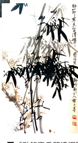
《勁節寒香留清輝》國畫52x86cm 譚文華