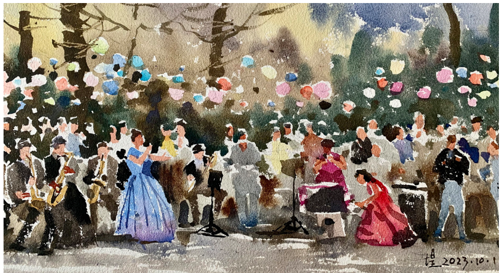
《音樂之城》紙本水彩36x51cm 王煥堤