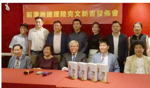
■2018年1月13日陸克文新書發佈簽名會一張合照