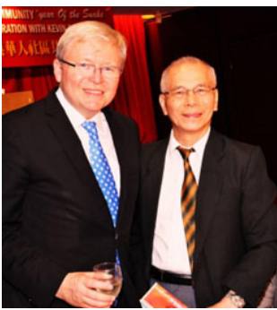
■本文作者與澳洲前總理陸克文的一張合照

具有巨大的震撼力。特別是在澳洲，在最近人們歡呼以色列對恐怖武裝組織極其成功的“斬首”行動以及嘲笑阿爾巴尼斯總理終於取得中共同意在年底前取消龍蝦禁令的“偉大勝利”之際，這位曾經於2013年11月13日宣佈退出澳大利亞政界的人所寫的新書在澳洲政壇不能不引起極大關注。值得注意的是，不管自由黨還是工黨，兩黨都承認這本書的價值，給以不同程度的稱贊。澳洲工黨人士，尤其與陸克文關係密切的人，普遍認為這本書對理解中共在全球舞台上不斷演變的角色具有重要意義。他們強調了陸克文的分析的針對性，認為他對習近平意識形態世界觀的洞察對於塑造澳大利亞對華外交和戰略政策至關重要，也支持陸克文提出需要與中國進行謹慎而且堅定的接觸。澳洲自由黨成員更加關注習近平強硬的外交政策和中共在印太地區影響力日益增強的潛在風險。影子外交部長西蒙·伯明翰(Simon Birmingham)強調澳大利亞需要加強防禦並與美國等盟友保持緊密合作，特別是在陸克文書中描繪的習近平雄心勃勃的背景。澳大利亞歷史上任期最長的前外交部長亞歷山大·唐納(Alexander Downer)稱贊此書為“不錯的作品”，抓住了習近平統治的複雜性。影子內政部長詹姆斯·帕特森(James Paterson)也認為澳大利亞需要加強防禦並準備應對中國可能的魯莽行為。總體而言，他們傾向於將陸克文這部書視為西方應對中國咄咄逼人態度的警鐘，認為此書是參與國際關係政策制定者的“必讀之作”。