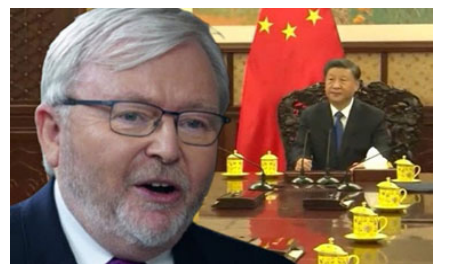
■陸克文與習近平皇帝之夢

今年的諾貝爾經濟學獎得獎作品，為我們提供了理解中國經濟問題的重要理論基礎。制度的靈活性、創新動力的激發、資源配置的優化，以及財政管理的透明度，都是中國未來經濟發展的關鍵所在。借助這些學術洞見，中國或許能更有效地應對當前的經濟挑戰，實現長期的繁榮與穩定。只有通過根本性的政治與經濟改革，中國才能釋放出潛藏的經濟潛力，創造出一個更加可持續和包容的增長環境。（2024年10月20日）