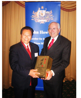
■ 康道公司王海光董事長與澳洲總理約翰·霍華德合照。