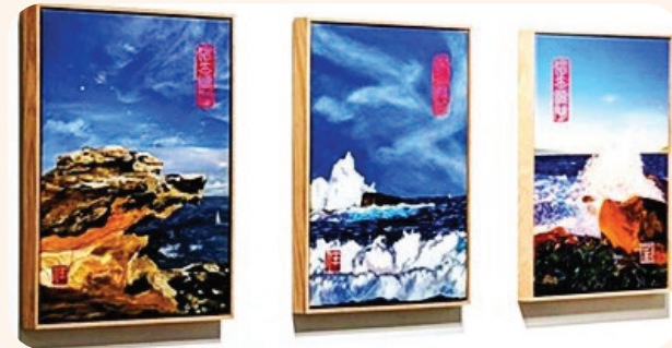
任靜敏參展作品《心印流年：邦迪系列-獨立山海間》