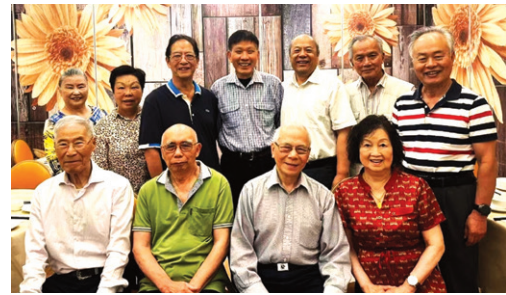
京唐酒樓雅聚合照

墨海驥珠勞六龍，華章璀璨耀雲峰。 序文讀罷心如水，錦句拈來韻滿胸。 雅室欣聞金縷曲，瓊筵喜奉玉壺濃。 此生有幸入詩會，師德高風沐老松。