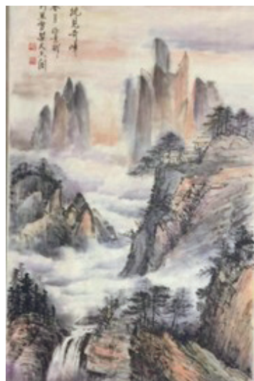
徐素彬國畫山水《雲霧繚繞見奇峰》 126 X 68 cm