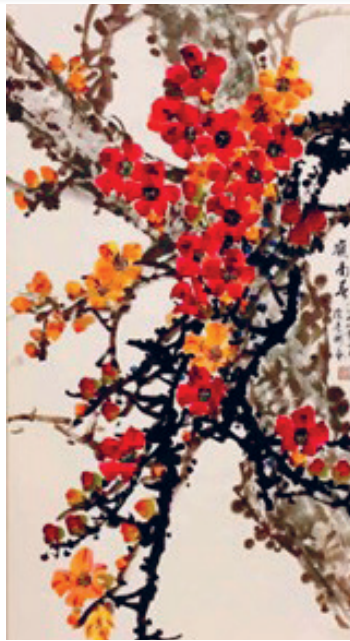
徐素彬國畫花鳥《嶺南春》 138X 68cm